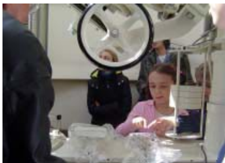
Kinder in der Sternwarte im Einsteinturm.

schaftlichem Gebiet liegen. Logik gilt noch immer nicht als positive weibliche Eigenschaft. Dadurch fallen innere und äußere Welt immer mehr auseinander, was eine völlige Abkapselung zur Folge haben kann. Das Mädchen wird zur Außenseiterin. Darunter leidet ihre Gesundheit und Persönlichkeit - auch noch in späteren Jahren.