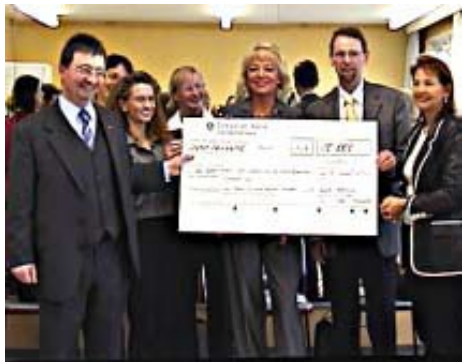
Scheckübergabe des Lions Club Berlin-Roseneck an den Förderverein am 24. April 2002.