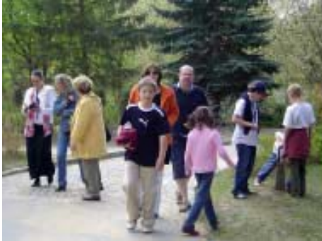
Eltern mit Kindern beim Ausflug zum Einsteinurm

mit das Bildungssystem in Berlin die Förderung hoch begabter Kinder als Selbstverständlichkeit in seinen Pflichtenkatalog aufnimmt.