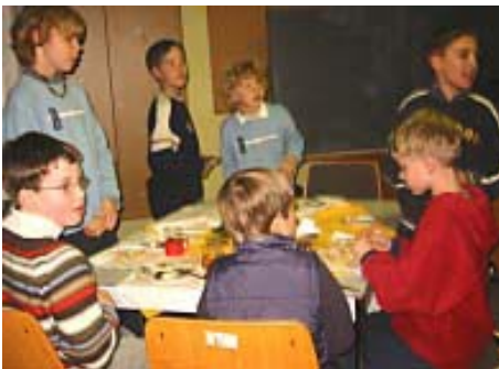
Kinder unseres Fördervereins bei der Weihnachtsfeier. Die meisten haben sich vorher noch nicht gekannt, aber sie haben sich auf Anhieb verstanden.

„Wir müssen die jungen Talente besser pflegen“ sagt die Bundesministerin für Bildung und Forschung Annette Schavan. Wir hoffen, sie meint auch die Talente auf der geistigen Ebene.