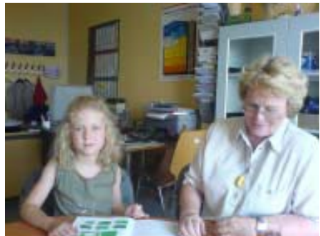
Beratungs- und Testsituation

Insgesamt haben wir bis heute ca. 250 Beratungen mit Diagnostik durchgeführt und zum Teil schriftliche Kurzgutachten kostenlos angefertigt, ca. 400