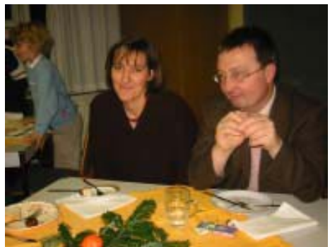
Eltern des Vereins bei einer Weihnachtsfeier.

Die dritte Säule der Vereinstätigkeit ist es, eine Lobby für die umfassende Förderung hoch begabter Kinder zu sein. Wir versuchen, nicht nur die Öffentlichkeit für die Schwierigkeiten der Kinder zu sensibilisieren, sondern auch in den politischen Raum hinein zu wirken, da