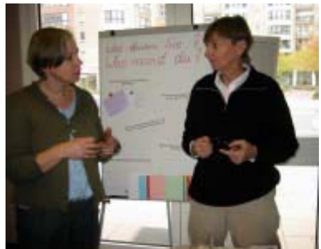
Eltern im Gespräch zum Tag der „offenen Tür“.