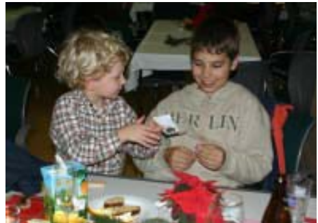
Kinder beim Knobelspiel

Mit der Feststellung der Hochbegabung eines Kindes sind die Probleme keineswegs gelöst – das zeigen die vielen Elternfragen in unserem Förderverein. Lehrer und Eltern müssen gemeinsam nach Lösungsmöglichkeiten für den erhöhten, mitunter auch ausgefallenen Wissensdurst des hochbegabten Kindes suchen. Nur über eine gemeinsame und vertrauensvolle Zusammenarbeit aller Beteiligten werden einigermaßen akzeptable Lösungen ge-